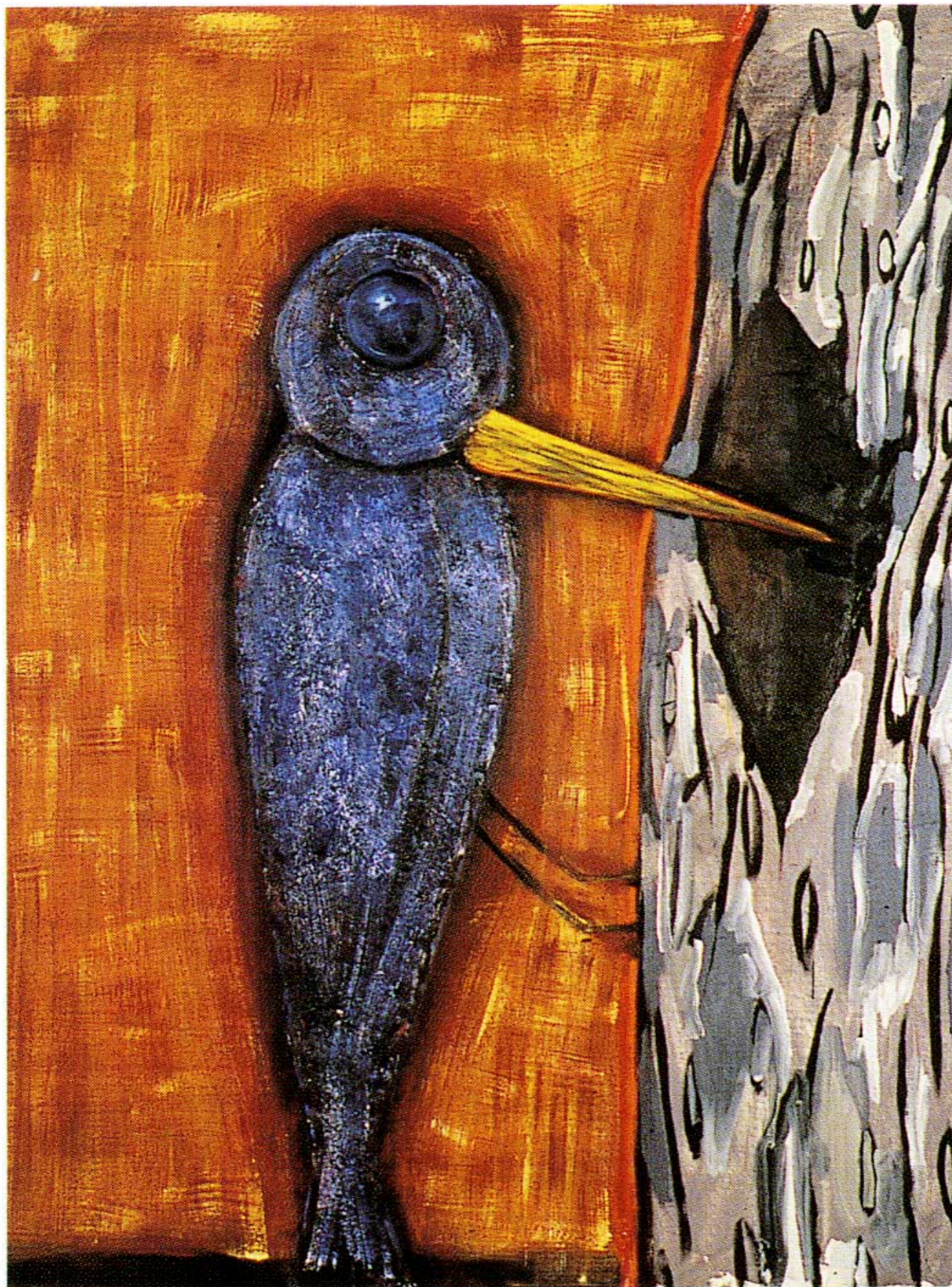
JUDITH LINHARES, Woodpecker , 1985, oil on canvas, 48" x 30".