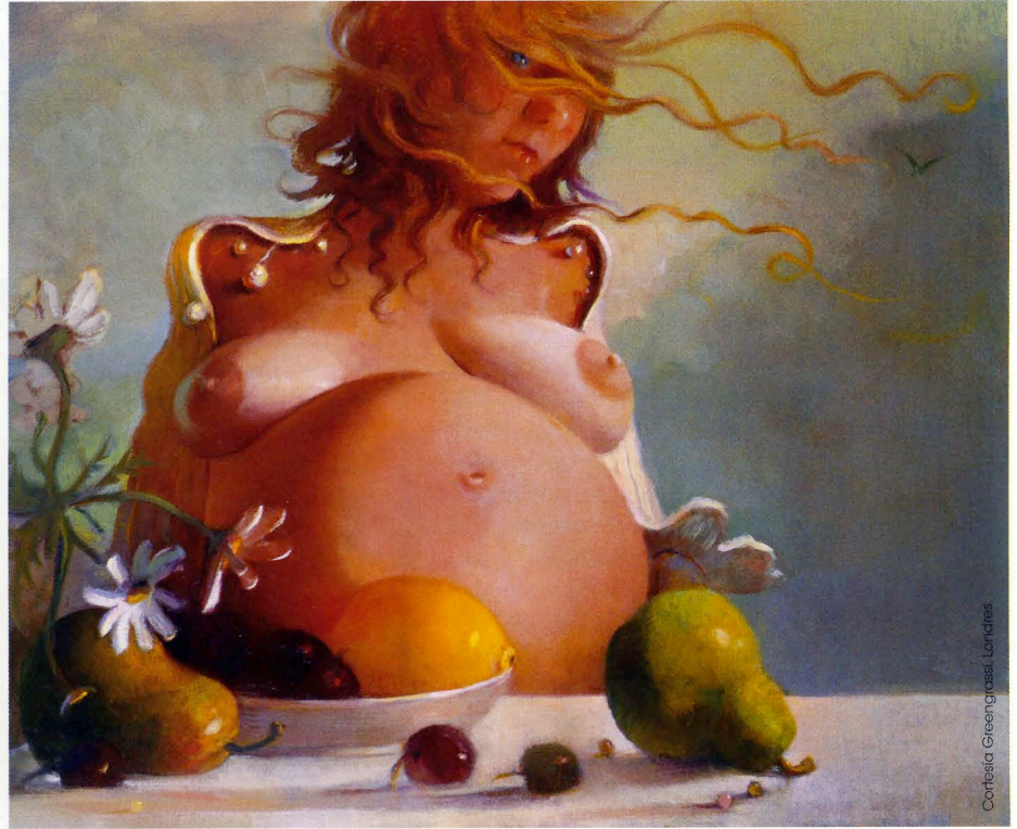
Still Life, 2003. Óleo sobre tela. 52.07 x 53.34 cm. Colección privada, Nueva York.

misma analogía, pues la naturaleza muestra formas caricaturescas y no por eso dejan de ser verdaderas o incluso bellas. En cualquier caso, son criaturas que llegan a habitar el cuadro de una forma misteriosa y fascinante.