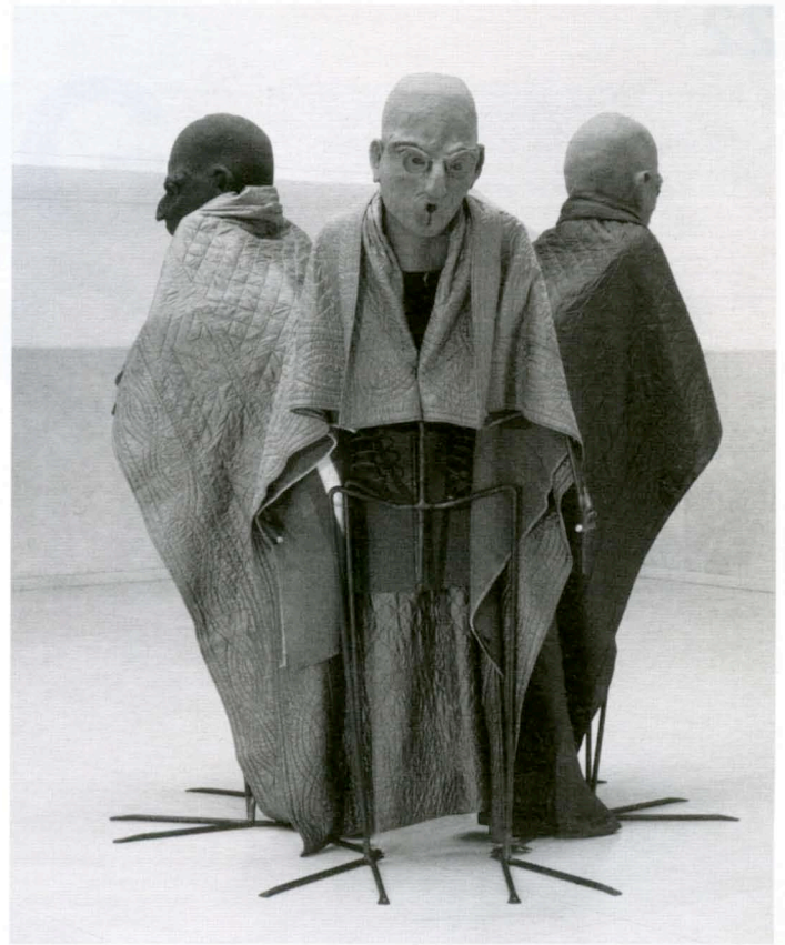
Thomas Schütte Three Capacity Men , 2005 staal, siliconenrubber en katoenen dekens / steel, silicon and blankets hoogte / height: 250 cm The Monique Zajfen Collection