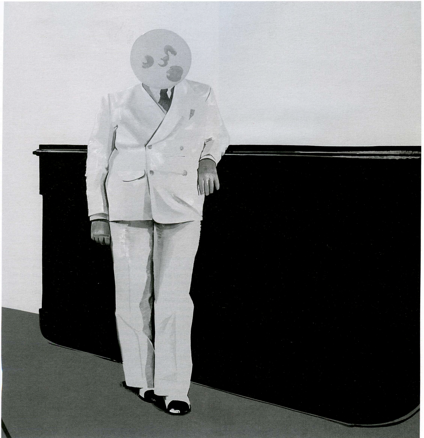
Wilhelm Sasnal Untitled (Brasil) , 2006 olieverf op doek / oil on canvas 190 x 190 cm The Monique Zajfen Collection