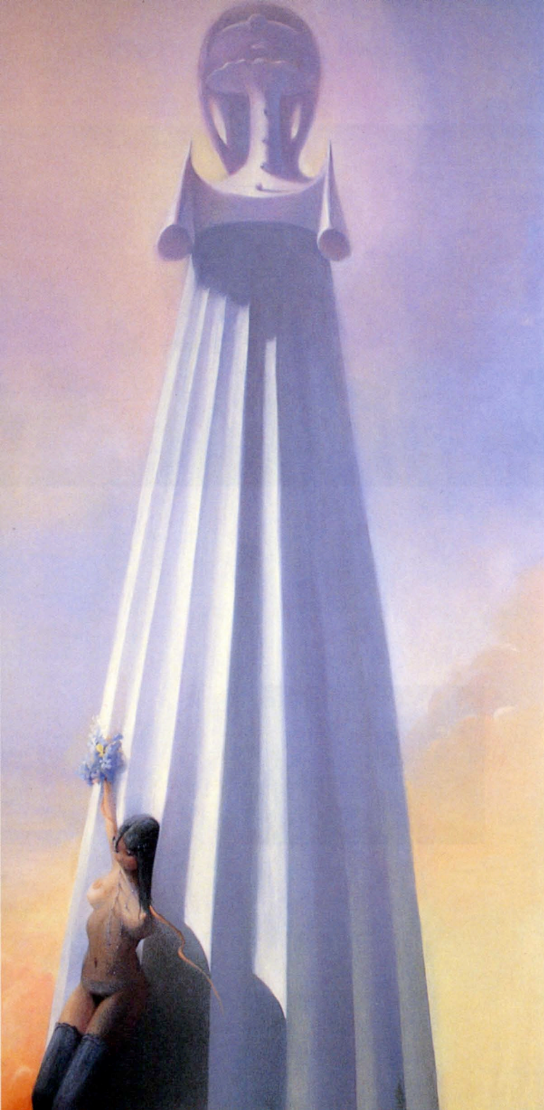
運命の現われ 1998 麻布に油彩 279.4×139.7cm