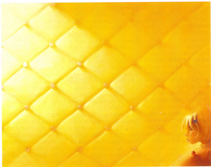
ビッグ・リトル・ローラ 1998 キャンヴァスに油彩 193×243.8cm